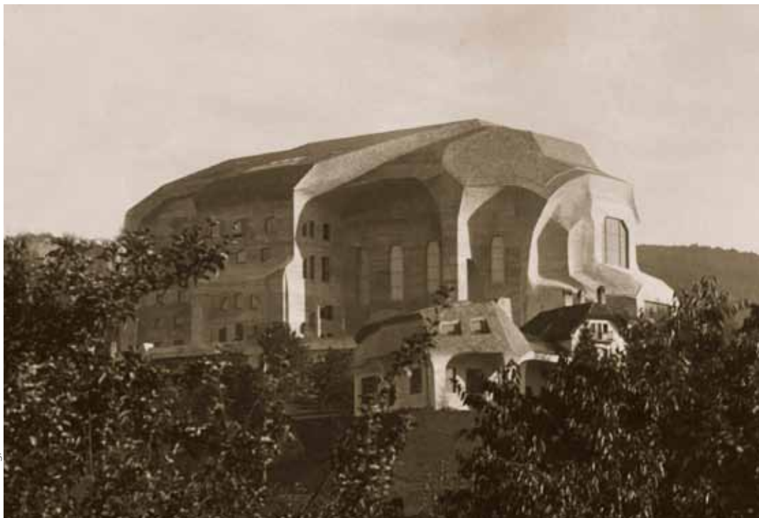
Das Goetheanum in der Ost-West-Achse. / Le Goetheanum dans l'axe est-ouest.

Zukunft heiliges, geistiges Christus-Sonnenlicht erstrahlt – wenn die Menschheit es will, wenn die Menschheit sich dazu reif machen will.» 18 Mit diesem Zielbewusstsein gestaltet sich die konkrete Aufgabenstellung der Allgemeinen Anthroposophischen Gesellschaft, einer Gesellschaft des «esoterischen Ernstes», an der Rudolf Steiner trotz all der mit ihr verbundenen Einbrüche und Enttäuschungen bis an sein Lebensende festhielt: «Niemandes Hochmut möchte ich aufstacheln, aber wiederholen möchte ich doch ein Wort, das einmal gesprochen worden ist, als auch bei grosser Gelegenheit die Rede davon war, was geschehen soll durch die Gemüter, die etwas aufgenommen hatten, die es hinaustragen sollten. Es wurde diesen Gemütern — auch nicht um ihren Hochmut zu erregen, sondern an ihre Demut appellierend — gesagt: «Ihr seid das Salz der Erde.» 19