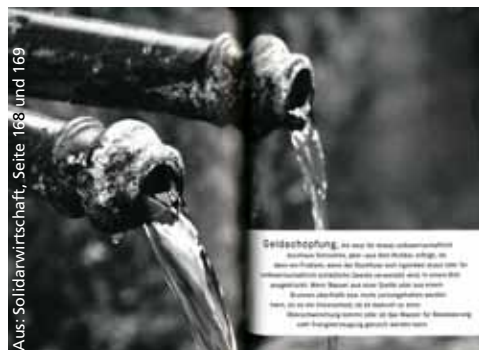
Aus: Solidarwirtschaft, Seite 168 und 169