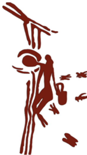
Bienenjäger, Skizze einer 9000 Jahre alten spanischen Höhlenmalerei. Chasseur d'abeilles: peinture rupestre espagnole datant de 9000 ans.

Le titre choisi pour le premier congrès d'automne de la Société anthroposophique suisse n'a rien d'anthropocentrique mais reflète bien la volonté et l'orientation qui ont été proposées et exprimées lors de ce week-end de travail: l'homme doit d'abord devenir capable de ressentir véritablement son intime parenté avec tout ce qui existe dans le monde manifesté, et il doit aussi se souvenir de sa parenté spirituelle, et apprendre à puiser dans cette parenté les forces véritables dont il a besoin pour agir en retour dans le monde. En d'autres termes, il doit se relier, puis agir. C'est le premier de ces deux gestes qui a surtout été représenté ici, ce congrès étant bien animé par des apiculteurs mais pas prévu uniquement pour des spécialistes.