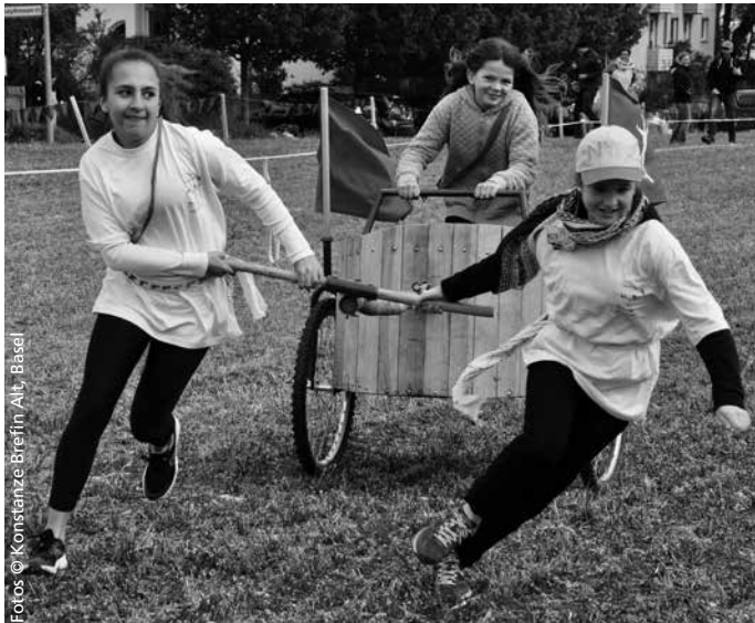
Mächtig angefeuert beim Wagenrennen, ...