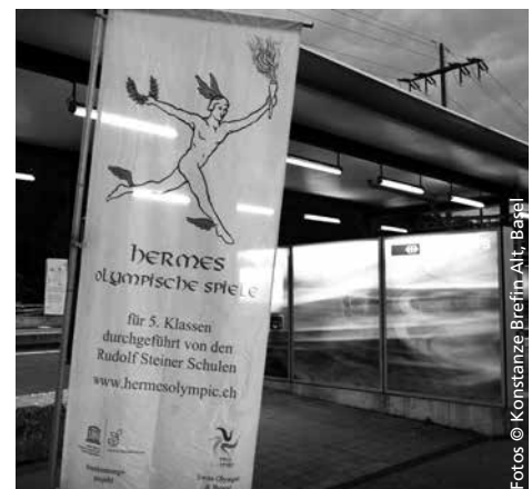
Hermes begrüsst am Bahnhof Aesch.

an diesen erstmalig auf zweimal zwei Tage angesetzten Hermes Olympischen Spielen in Aesch BL, um sich sportlich-spielerisch und gegenseitig anfeuernd zu messen. Obwohl Kälte angesagt war, spielte das Wetter gnädigerweise zum Teil mit, und wo nicht, boten die nahestehenden Gebäude der Birsecker Schule Schutz. Neu waren der Ori-