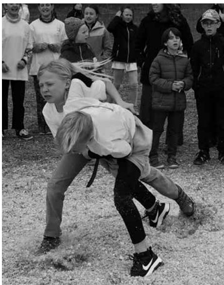
... und beim Ringen.