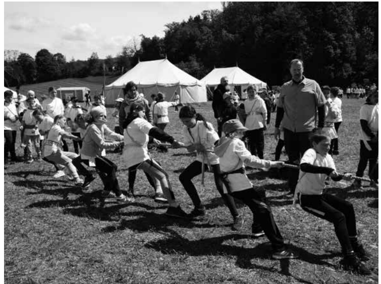
... beim Seilziehen ...