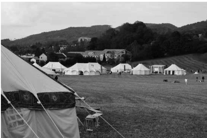
So präsentierte sich die Zeltstadt bei der Ankunft.

Am 6./7. und am 14./15. Mai 2019 fanden zum 20. mal die Hermes Olympischen Spiele statt und bildeten den Start für die Veranstaltungen zum 100-Jahr-Jubiläum der Rudolf Steiner Schulen.