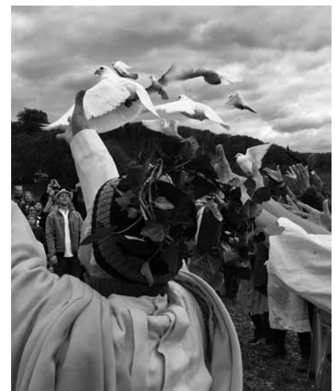
Die Tauben fliegen den Kindern voran.