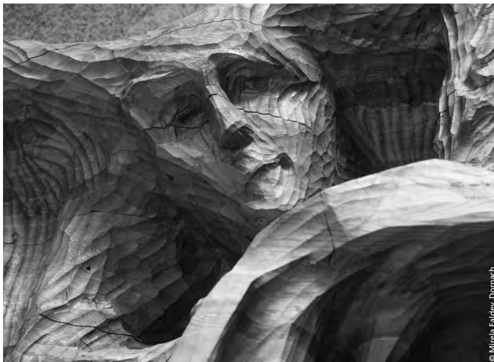
Das Felsenwesen / L'être des rochers