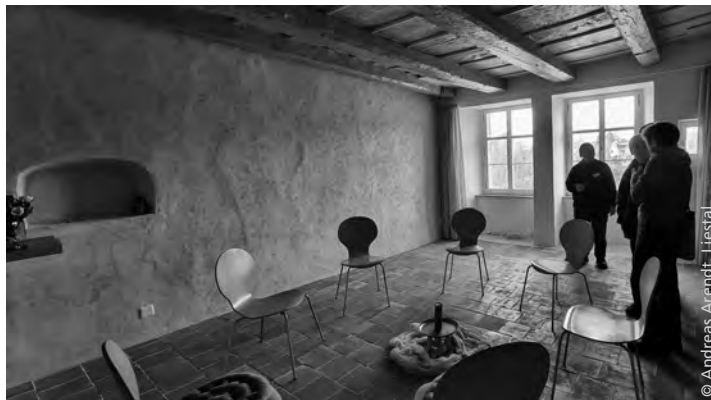
Das Lokal des Zweigs in Wil. / Le local de la branche de Wil.

Das Zweiglokal, acht, neun Häuser weiter unten an der Marktgasse 46 zu besichtigen hatten wir nach dem Mittagessen Gelegenheit. Es ist im Parterre eines alten Gebäudes von 1346 mit einer sehr seltenen mittelalterlichen gewerblichen Feuerstelle im Vorraum. Der Zweigraum selbst wirkt unglaublich harmonisch mit seiner schweren Balkendecke in sogenanntem Hardenberg-Blau. Der Blick durch das Fenster geht auf den Stadtweiher. ( www.zweig-wil.ch )