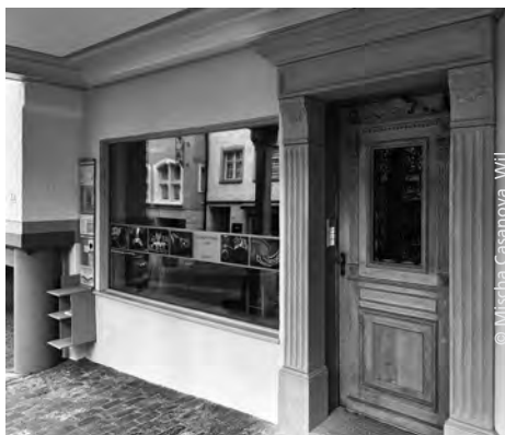
Der Eingang des Lokals des Zweiges in Wil an der Marktgasse 46. / L'entrée du local de la Branche de Wil, Marktgasse 46.