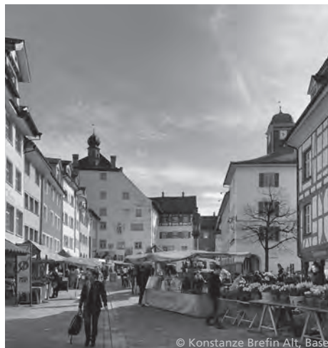
Der Wiler Markt mit dem Hof zu Wil im Hintergrund links. / Le marché de Wil avec le «Hof» en arrière-plan.

Il est toujours intéressant de voir comment travaillent les différentes Branches dans leurs particularités humaines et en accord avec l'esprit du lieu. Alors comment se passe une