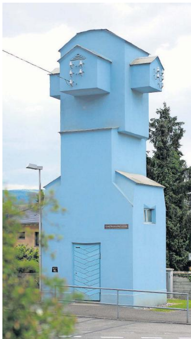
Das von Rudolf Steiner entworfene Transformatorhaus (1921) könnte beinahe für das Vitraahaus von Herzog und De Meuron Pate gestanden sein.