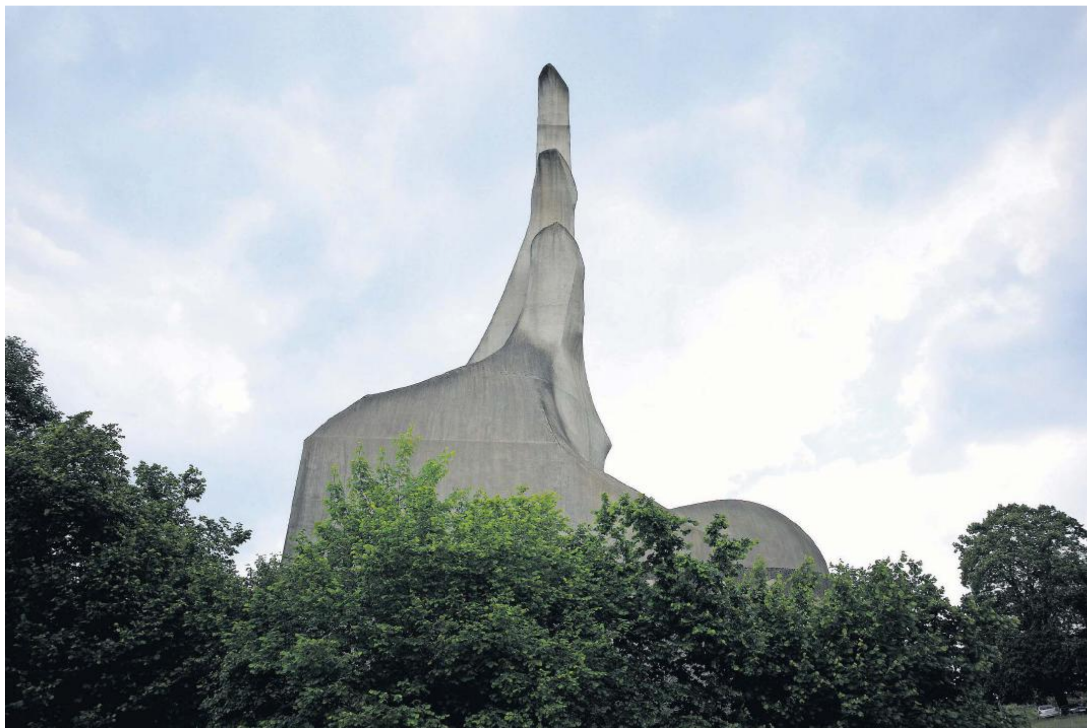
Der markante Zacken-Kamin des Heizhauses (1914). In dieses Gebäude ist